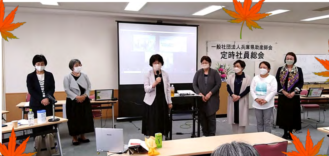
2022年度定時社員総会での新理事の皆様の様子

さて、兵庫県助産師会は今年創立90周年を迎えます。11月3日には多くの会員の皆様に参加していただける形での記念行事を計画しています。一般社団法人に移行し10年を経て、私たち助産師の今を見つめ、次の世代へと引き継ぎながら新たに取り組むべき課題を会員の皆さまと共に考える機会にしたいと思っています。皆様のご参加をお待ちしています。