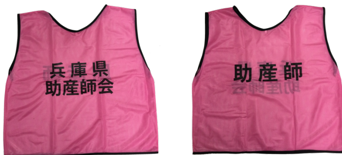
兵庫県助産師会 災害用ビブス