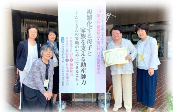
日本助産師会通常総会・学会の会場前にて