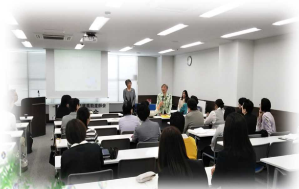
兵庫県助産師会定時社員総会の様子